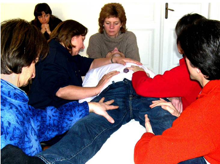
Figure didattico/professionali del TI: il medico supervisore e il docente che sono anche i conduttori dei gruppi di discussione.

Inoltre sono previste le figure dei capo-terapisti che, alternativamente, conducono l'operato dei terapisti preposti ad ogni paziente in ogni trattamento.